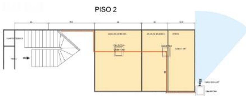
Diagrama 4: Ubicación cámaras piso 2 CTP La Minorista