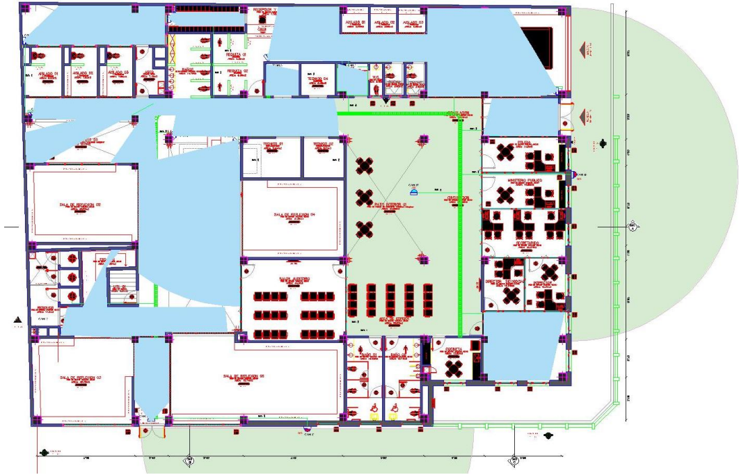
Diagrama 1: Ubicación cámaras piso 1 CTP Barrio Corazón de Jesús