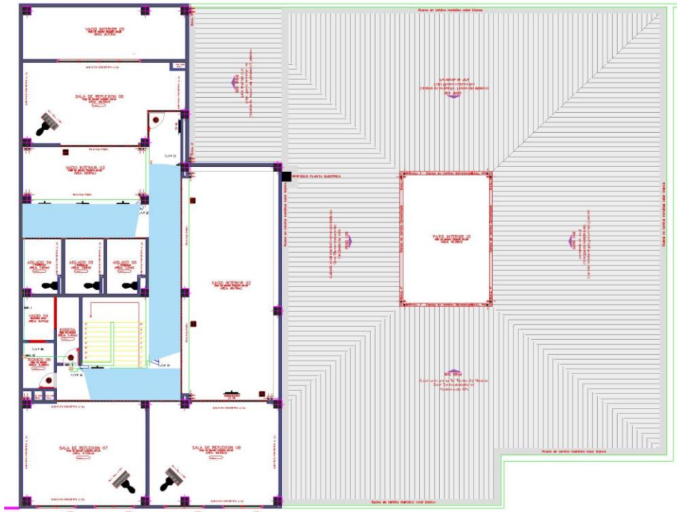
Diagrama 2: Ubicación cámaras piso 2 CTP Barrio Corazón de Jesús