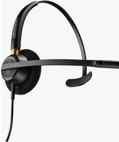
Ilustración 1. Diadema micrófono negro transparente